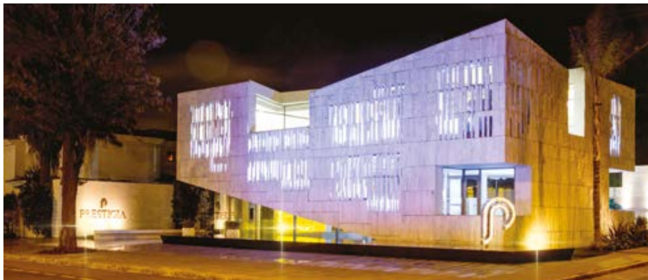
Galerie de l'immobilier Prestigia Anfa