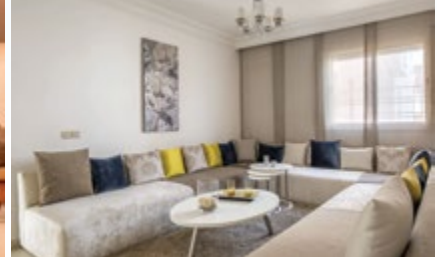
Méhdia • Appartement social