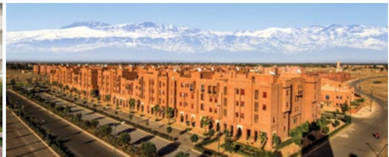
Chwiter • Appartements