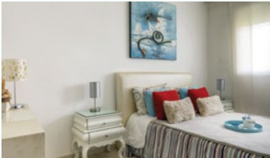
Riad Tanger • Appartement social