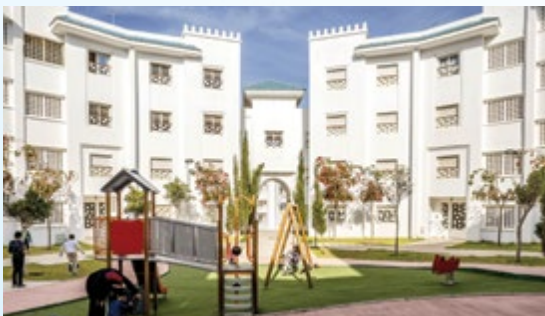
Bab Sebta • Appartement moyen standing