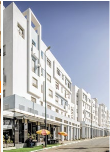
Riad El kheir Ain Aouda • Locaux commerciaux